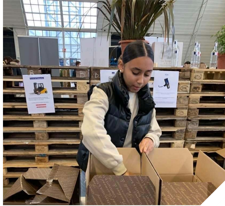
VISITE DU SALON LOGISTIC EXPO À CHALON SUR SAONE