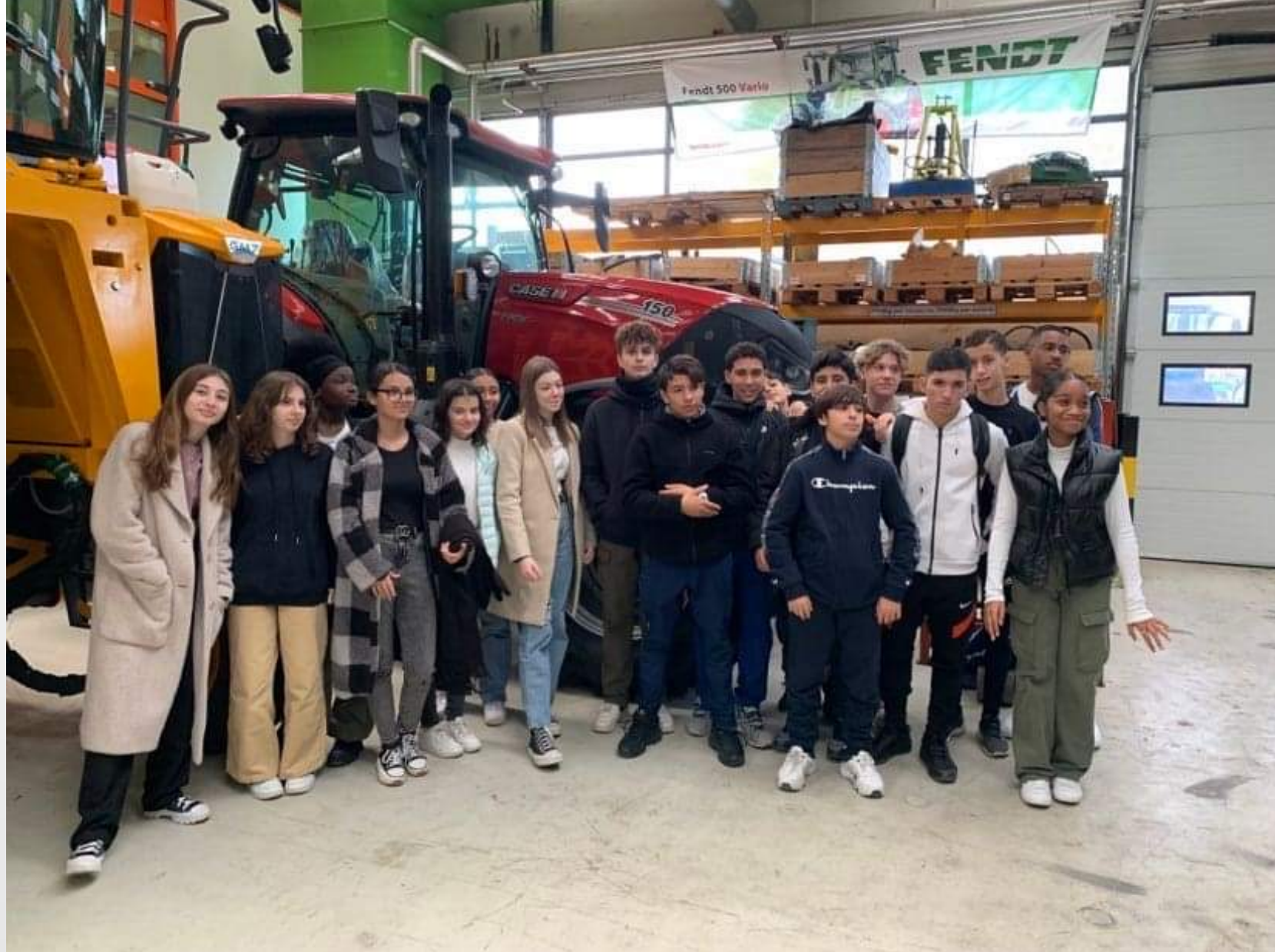
VISITE DES PLATEAUX TECHNIQUES DU LYCÉE CASSIN